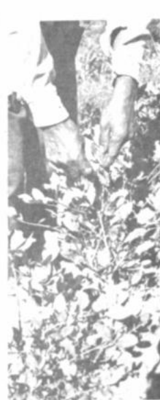
El presidente de Bolivia lo señaló muy bien en su brillante discurso ante la Organización de las Naciones Unidas de cómo el problema fundamental del productor es cómo subsistir las economías, lo denominaba como lograr el desarrollo, frente al elemento del tráfico ilícito.

Todo esto configura un delito contra la humanidad tal cual lo han definido en foros internacionales, pero también las gravitaciones y responsabilidades que son distintas.