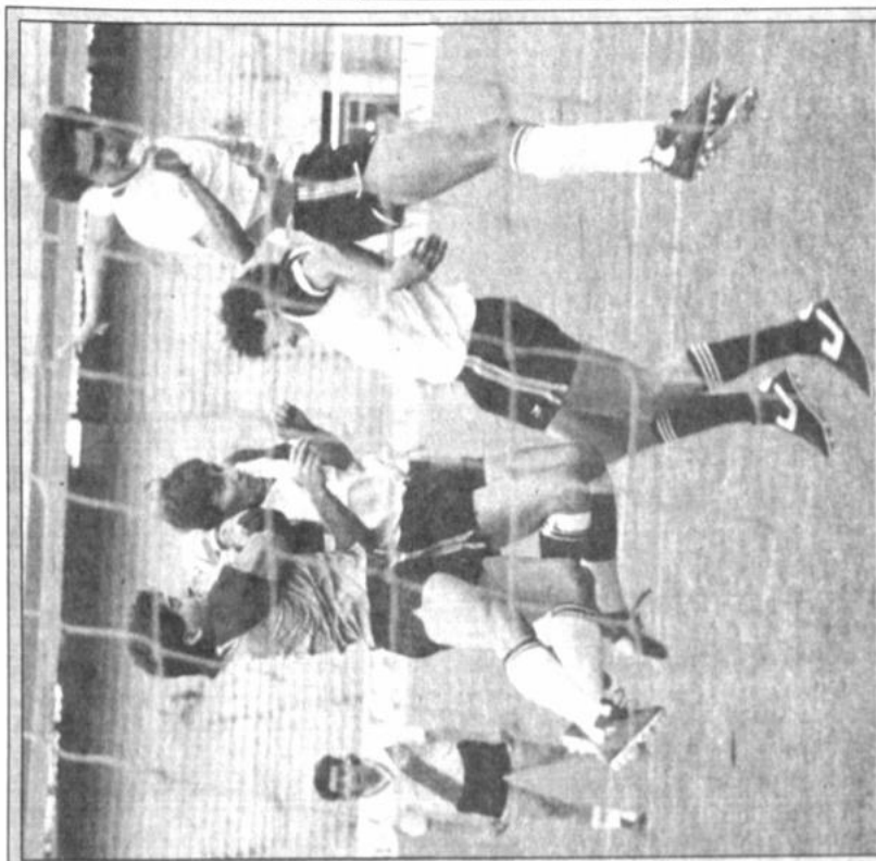
Líder Es quien corresponde al partido Destroyers Always Ready en el estadio Hernando Siles. Venció 1-0 a Always Ready por 1-0. En la foto se ve a los jugadores de Destroyers en su cancha para competir al nivel.