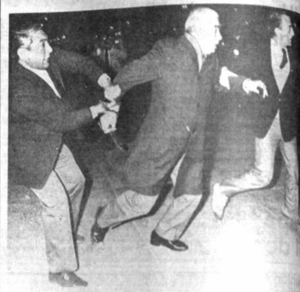
Atacando a un grupo de manifestantes Foto de archivo de agosto de 1984 del general Luciano Bernaldo, cuando atacó un grupo de manifestantes que lo esperaban a la salida de un Canal de televisión. Menem, tras grandes violaciones a los derechos humanos, fue indultado por el presidente Menem junto a otros también procesados por la misma causa (Buenos Aires, Teletipo APT).