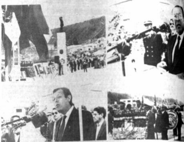
En un solemne acto, donde estuvo presente el primer mandatario de la nación, Jaime Paz Zamora, los ministros de Relaciones Exteriores, Interior, Aeronáutica, Defensa, Dicciones, diplomáticos y otros, se declaró héroe nacional y almirante de la Armada boliviana a Miguel Grau...