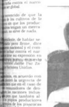
Luis Ossio Sanjinés, Vicepresidente de la República.

• Sustituir la coca con productos que no tienen mercado, no sirve de nada.