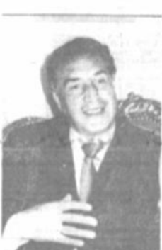
Luis Ossio Sanjinés, Vicepresidente de la República.

• Sustituir la coca con productos que no tienen mercado, no sirve de nada.