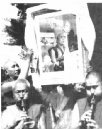
Festejo Refugiados tibetanos en India transportan retratos de Dalai Lama y tocan música para festejar la concesión del Premio Nobel de la Paz a su líder espiritual (Nueva Delhi.).

Los tres integrantes de la coalición de la resistencia camboyana, cuyo principal ejército guerrillero es el Khmer Rouge, reciben armas de China.