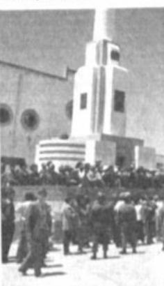
Entrega de maquinaria El presidente de la República Lic. Jaime Paz Zamora realizó la efímera cívica del 6 de octubre de 1989, al momento de cumplir su promesa de agradecer a Oruro por el triunfo que le dio en las elecciones del pasado 7 de mayo.

se dominante, que debe escoger entre un proceso transformador acordado, que garantice parte de sus privilegios, o el camino de la violencia que pondrá en riesgo todos sus privilegios".