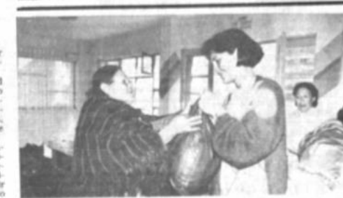
Entrega de alimentos

La presidenta de la Junta Nacional de Solidaridad y Desarrollo Social, Rosario Paz Zamora, entregó ayer, en homenaje al "Día de la mujer", alimentos a las viudas de beneméritos e inválidos de la Guerra del Chaco, que se encuentran en condiciones de extrema pobreza. En el acto, la presidenta de la Junta anunció que para el "Día de la mujer" se han programado dos acontecimientos: la entrega de esos alimentos y la inauguración del consultorio jurídico de la mujer, que dará asesoramiento legal a mujeres y ancianas de condiciones económicas deprimidas. "Nosotros no ofrecemos ni prometemos, estamos cumpliendo porque es nuestro deber trabajar por quienes han sacrificado sus vidas por nuestro país, y es también nuestra obligación trabajar por los necesitados, mujeres, niños y ancianos", concluyó.