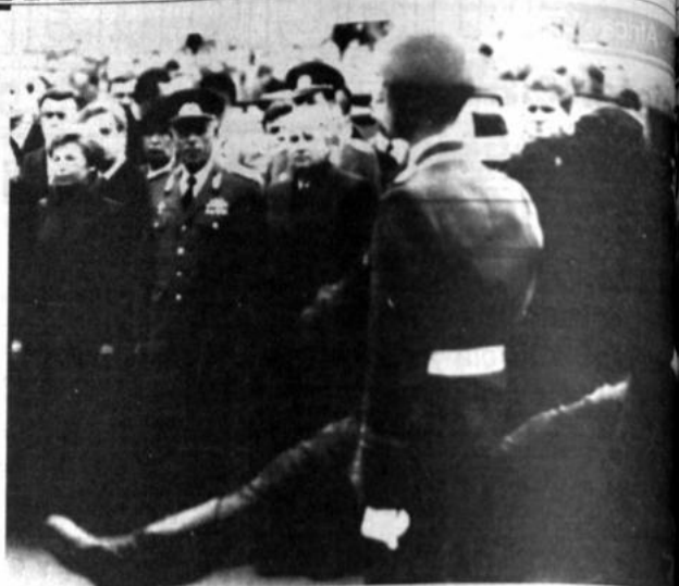
Desfile. Soldados alemanes orientales pasan frente a Raisa Gorbachov, el ministro de Defensa alemán, Helmut Kessler y Mijaíl Gorbachov durante un desfile realizado en el Boulevard Unter den Eichen, Berlín Oriental, Radiofoto AP.