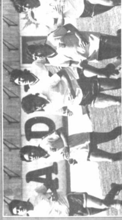
Práctica de The Strongest. El primer plantel del club The Strongest reanudó sus entrenamientos ayer en Achumani con miras a su próximo congreso.