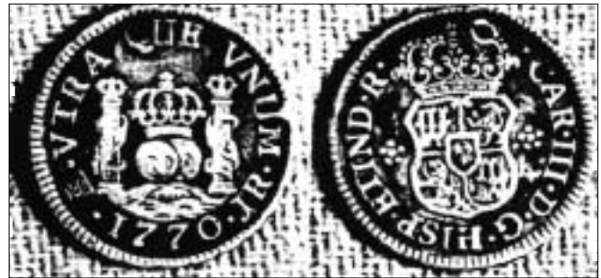
Real acuñado en Potosí bajo el reinado de Carlos III (1770). Anverso: ambos mundos. Reverso: escudo de Castilla y flores de lis..

Plata" por los ejércitos expedicionarios argentinos, entre 1813 y 1815.