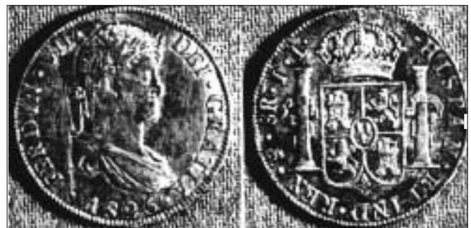
Peso de Ocho Reales acuñado en Potosí bajo el reinado de Fernando VII (1825). Anverso: efigie real. Reverso: escudo de Castilla.

La República está representada en la primera moneda acuñada con la efigie del Libertador, fechada en 1827, hasta 1863 en que la imprenta varía y la efigie es reemplazada por el Escudo Nacional, así como la denominación de Pesos y Soles es sustituida por Bolivianos, en coincidencia con la instauración del sistema decimal.