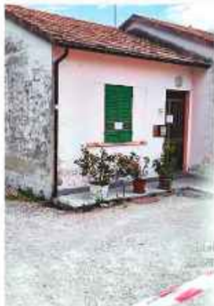
CRIMEN. La vivienda donde la víctima murió.

El hombre se entregó por la noche a la Policía italiana. La víctima era oriunda de Santa Cruz y vivió y trabajó en ese país varios años, informaron sus familiares.