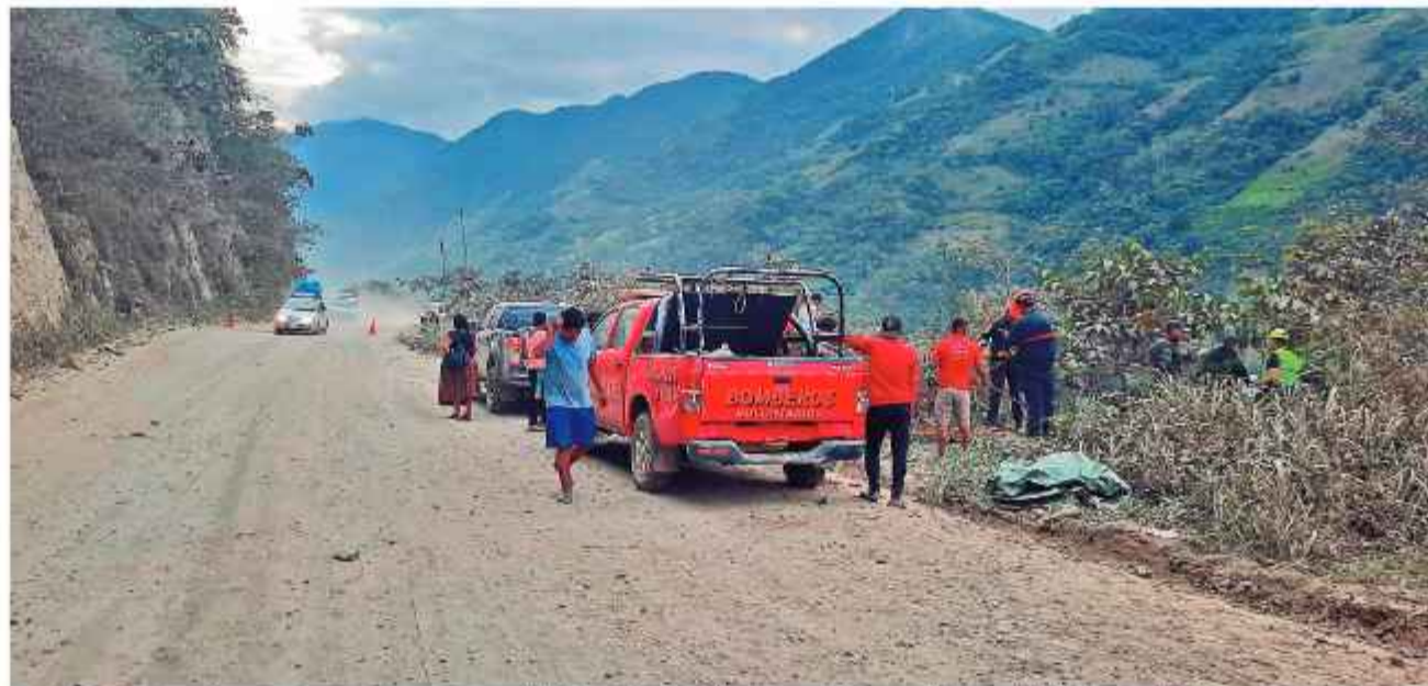
ACCIDENTE. Bomberos Voluntarios y personal de la Policía Rural y Fronteriza en el lugar del hecho, sobre la ruta La Paz-Yungas.

UN NIÑO DE OCHO AÑOS ES EL ÚNICO QUE VIVIÓ