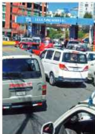
FILAS. Vehículos esperan cargar carburantes.

En tanto, el presidente de YPFB, Armin Dorgathen, señaló que hay un déficit de 300 millones de dólares en los pagos que se debe hacer por la importación de diésel y gasolina para el mercado interno.