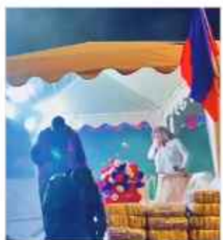
ATENTADO. Gas lacrimógeno invade la sede manfredista.

Desconocidos lanzaron ayer por la tarde un ataque con granadas de gas lacrimógeno en contra de la casa de campaña que militantes de Autonomía para Bolivia (APB-Súmate) en la zona Sur de Cochabamba.