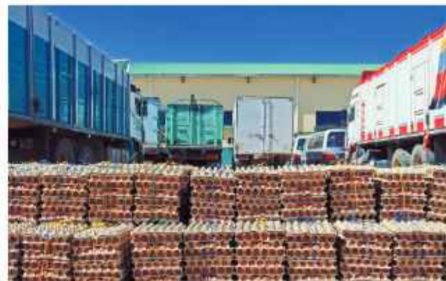
COMISO. Las cajas del producto que fueron decomisados.

El ministro de Agricultura de esa nación, Esteban Valenzuela, explicó que el aumento responde a mayores controles, pero también advirtió de que "el altiplano es poroso" y se requieren nuevas medidas de control y coordinación.