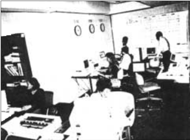
Sala de negociaciones de la subgerencia de Operaciones Internacionales del BCB, nivel encargado del manejo de las operaciones con las Reservas Internacionales, el control de las mismas y el organismo y el seguimiento de la tasas interés

Esta administración efectiva permitió el normal funcionamiento de los pagos internacionales del país y la obtención de importantes rendimientos traducidos en un ingreso total anual de 23,8 millones de dólares.