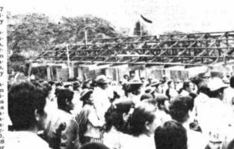
Techoado del hospital de Coroico

Con la asistencia de campesinos de Chulumani, Irupanya y Caranavi, comenzaron las obras de techado del moderno hospital de Coroico, que construye el Centro Italiano de Solidaridad de Roma (CeIs), que trabaja con el Proyecto Agropecuario, en virtud de un acuerdo suscrito con el gobierno de Bolivia.