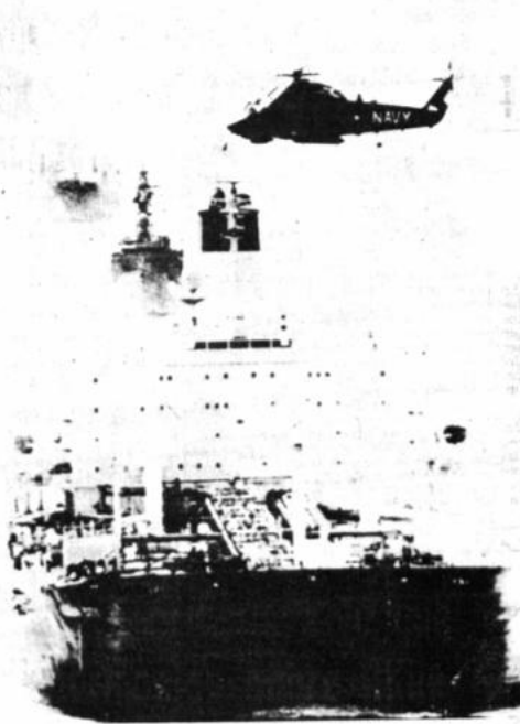
CUSTODIA. El petrolero "Ocean City" navega con un convoy con otros 20 buques cisternas custodiados por un helicóptero de la marina norteamericana al nordeste de Dubai en el Golfo Pérsico (Dubai, Radiofoto AP).

Los Contras luchan por derrocar a los sandinistas que llegaron al poder en julio de 1979 en una revolución que acabó con 42 años de gobierno por parte de la dinastía Somoza.