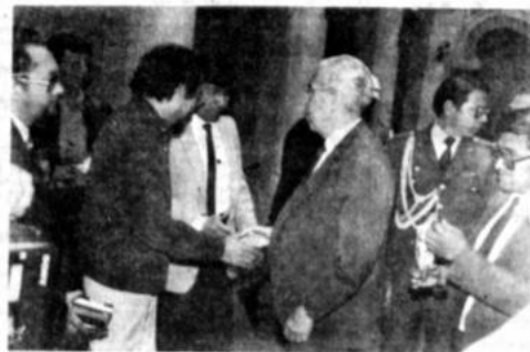
SALUDO A LA PRENSA. El presidente de la República, Víctor Paz Estenssoro, saluda a los periodistas acreditados en palacio de gobierno con motivo de la Navidad, desearles felicidades y exhortándoles a seguir con su misión responsable de orientar e informar a la población.