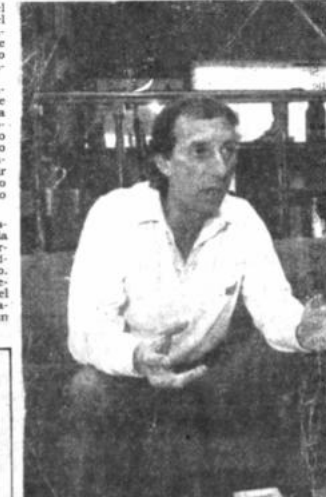
CARLOS SALVADOR BILARDO

Cuando Maradona estuvo la semana pasada en Buenos Aires no formuló comentario negativo alguno sobre Bilardo. Al contrario, en una declaración después del partido contra Alemania, lo calificó como "un fenómeno".