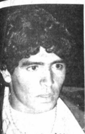
DIEGO ARMANDO MARADONA