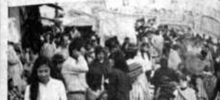
La crisis tiene varias caras: unas de angustia, de desesperación, de privaciones, de frustración, de desesperanza. La otra, la mejor, es la esperanza o siquiera posibilidad de que "a la vuelta de la esquina" se presentarán soluciones y que las dificultades de hoy, con el espíritu de siempre, se podrá superar o en cualquier caso aminorar su peso.

El espíritu de nuestras vendedoras de ropa es cada vez más especial porque a la paciencia que muestran al estar por muchas horas sentadas ofreciendo su mercancía, agregan la "ausencia" de los problemas que causan angustia a los demás. Ellas, junto al trabajo de sus maridos, en fabricar construcciones conforman un presupuesto para su vida, como su representación de progreso, de abundancia.