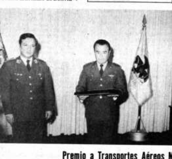
Premio a Transportes Aéreos Militares