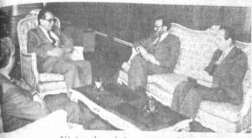
Visita de ministro español

Dichas explotaciones "son imprescindibles para sentar soberanía territorial en esas zonas fronterizas".- Se requiere una inversión mínima de $b 300 millones