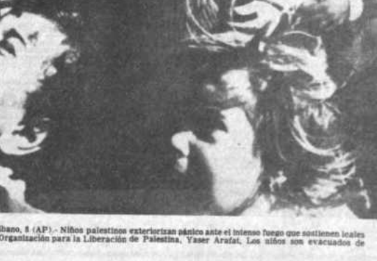
PANICO.- Tripoli, El Líbano, 8 (AP). - Niños palestinos exteriorizan pánico ante el intenso fuego que sostienen leales y subversivos del líder de la Organización para la Liberación de Palestina, Yasser Arafat. Los niños son evacuados de Tripoli (Radiofón AP).

La reunión fue convocada por la coalición opositora Alianza Democrática y según sus dirigentes se propone reunir a más de 500.000 personas para presionar al régimen militar para el pronto restablecimiento democrático. MONTEVIDEO, 8 (AP). - El ministro del Interior, general Hugo Linera Brum, advirtió esta noche que el gobierno impedirá la realización de una manifestación convocada para mañana por el Pícaro Interinstitucional de Trabajadores (PIT).