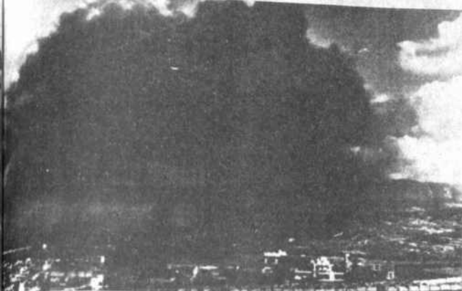
EL FUEGO CONTINUA.- Tripoli, El Líbano, 8 (AP). - Una impresionante nube de humo cubre el cielo de Tripoli, ocasionada por el intenso bombardeo entre leales y subversivos del líder de la OLP, Yasser Arafat. Arafat ofreció apoyar sus armas a los guerrilleros amotinados ponen fin a sus ataques que tienen como fin sacarlo de su último refugio.