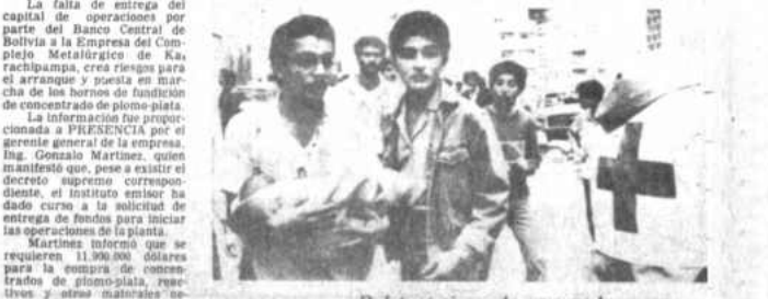
Bebé víctima de atentado

Se requieren $US 11.900.000 para iniciar trabajos