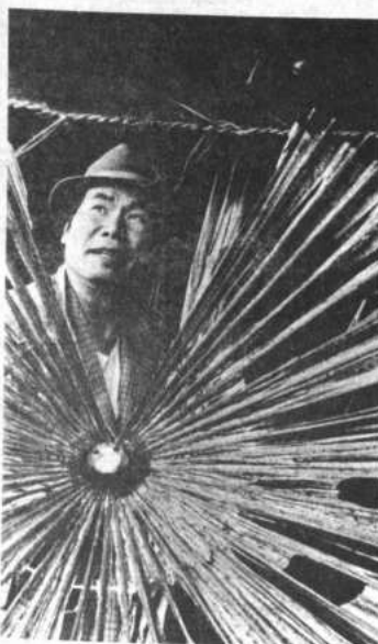
LA FOTOGRAFIA pertenece a "Dura es la vida del hombre", película del director japonés Yamada Yoji. Será exhibida mañana en el Cine 16 de Julio como parte del festival de cine japonés. El festival se prolongará hasta el viernes 11 de este mes. Auspicio de la Embajada del Japón.