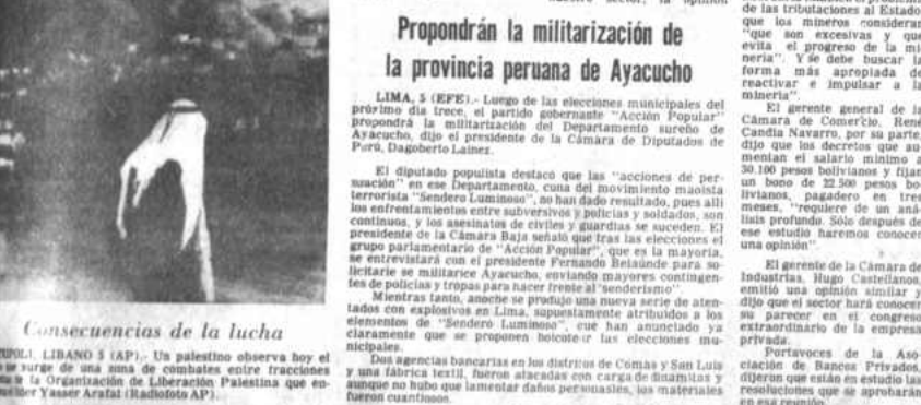
Consecuencias de la lucha

Las organizaciones que agrupan a los empresarios privados-minería, industria, comercio y banca, anunciaron ayer un "profundo y detallado análisis" de los últimos decretos gubernamentales sobre incrementos salariales y adelantaron criterios favorables y contrarios a esas disposiciones. Mientras algunos dijeron que "corresponde que la empresa privada observe las normas legales", otros señalaron que los aumentos recientes pondrían en serio riesgo la estabilidad económica de las empresas y que por tanto no pueden ser aplicados.