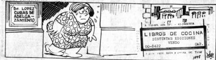
DANIEL EL TRAVIESO