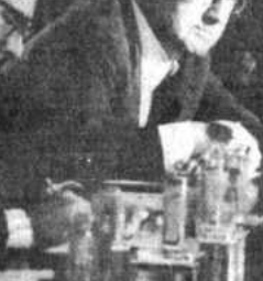
Kissinger en gira por Centroamérica

"Esperamos que lo tengamos listo para el día de mañana pasado mañana de manera que podamos discutirlo y actualizarlo para adoptar decisiones", manifestó. Dijo que, durante la sesión, los ministros del área económica y social del gobierno "consideraron exhaustivamente" el informe del ministro de Finanzas. Se tomó en cuenta el informe de conocimiento de la misión realizada ante el FMI y la banca internacional. También se informó sobre el deterioro de pago de los intereses en mora y capital, en el orden de los 15 millones de dólares, y la condonación de intereses penales y sobre otras gestiones y reorganizaciones de algunos financiamientos para el desarrollo.