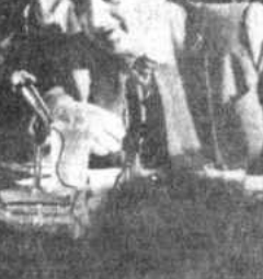
El presidente Siles en un momento de su discurso.