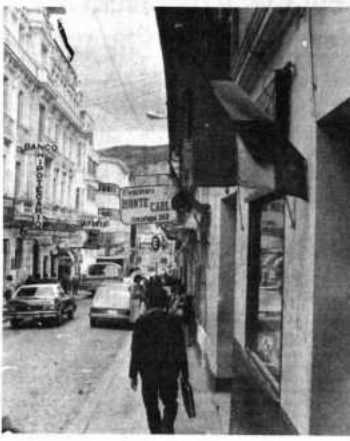
Aniversario de la democracia

El Tratado de Montevideo entró en vigor el 18 de marzo de 1981, al haberse completado el depósito de las tres primeras ratificaciones de los gobiernos signatarios. Fue suscrito en 1980 por los cinco países miembros. Sustituye a la Asociación Latinoamericana de Libre Comercio (ALALC) que funcionó durante 20 años.