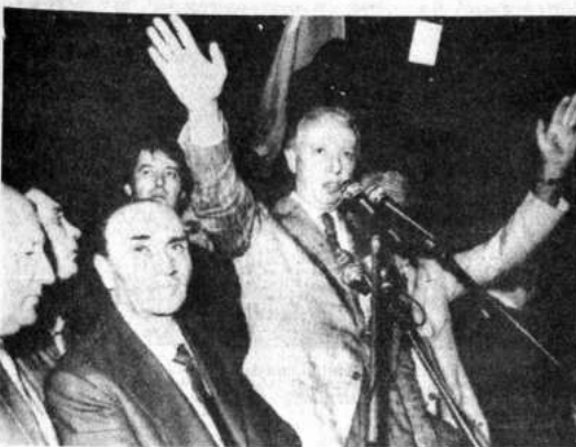
CAMPAÑA POLITICA.- Buenos Aires 10 (AP).- Italo Luder, candidato presidencial por el Partido Peronista, durante un discurso político pronunciado en la ciudad de La Plata.

Mientras tanto, fuentes sindicales afirman que la reunión del movimiento sindical