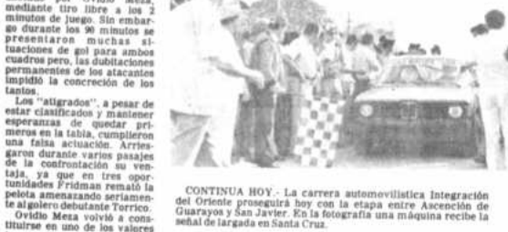
CONTINUA HOY. - La carrera automovilística Integración del Oriente proseguirá hoy con la etapa entre Acre y Guayaquil y San Javier. En la fotografía una máquina recibe la señal de largada en Santa Cruz.