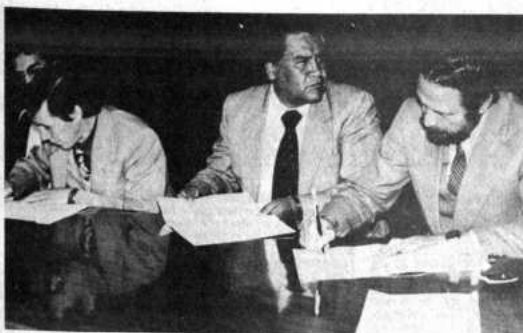
CONVENIO. - Autoridades de la Empresa Nacional de Fundiciones y de la Universidad Técnica de Oruro suscribieron un convenio de mutua cooperación, a través del cual se incentivarán los labores de investigación científica en la enseñanza profesional.