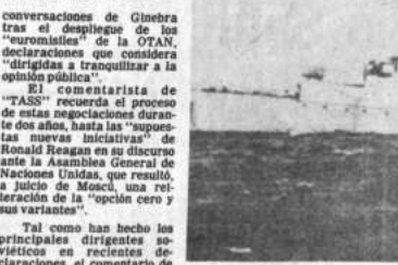
PATRULLAJE. Isla de Sakhalin, Unión Soviética, 29 (AP). Un corbeta de bandera soviética patrulla aguas territoriales cerca de la isla de Sakhalin, no lejos del lugar donde cayó un avión de aerolínea comercial surcoreana.

LONDRES, 29 (AP).- El número de desempleados, aumentado por los jóvenes que terminaron sus estudios y no consiguen trabajo, se elevó a 2,16 millones de personas, el mayor nivel de los últimos seis meses, y el comienzo de una nueva ola de desempleo del 13,3 por ciento.