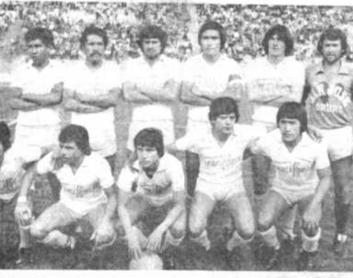
PERDIDO AYER. - Este es el primer plantel que ayer presentó San José de Oruro en su compromiso frente a The Strongest. Los "santos" no tuvieron fortuna y se resignaron con la derrota.

LIMA, 29 (EFE). El presidente de la Confederación Sudamericana de Fútbol, Teófilo Salinas, expresó hoy su esperanza de que la final de la Copa América se lleve a cabo en una sola sede. Salinas dijo que esperaba haya consenso para una sola sede y exista unanimidad de criterios al respecto, tras lo cual habrá que elegir esa sede y confeccionar el calendario, sea cual fuere la manera que se escoja. Negó que las federaciones de fútbol de los países clasificados hayan dirigido dinero para lograr la sede. Dijo que hasta el momento solo un canal de televisión de Perú había ofrecido 400.000 dólares para que Lima fuera la sede de la final de la Copa América, lo que fue aceptado por la Federación Peruana de Fútbol.