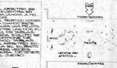
LA CANCHA DE VÓLEY ESTÁ PERPENDICULAR AL VIENTO. LOS JUGADORES DEBEN PASAR LA PELOTA HASTA LLEGAR AL ARCO.