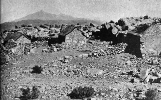
ABANDONADO. Un pueblito, entre las localidades de Llica y Abra de Napa, en el occidente potosino, fue abandonado por sus pobladores debido a las consecuencias de la sequía, de acuerdo a Chile en busca de trabajo.

POTOSÍ, 7 (PRESENCIA). - Un paro de 48 horas en esta capital, decretado por el Comité Cívico Potosino, por la gravedad de la crisis de agua y una angustia creciente en la mayoría de las 15 provincias por la falta de alimentos, a raíz de la sequía, conforman un panorama tenso y hasta explosivo en este departamento que, como ningún otro, está agobiado por desastres naturales.