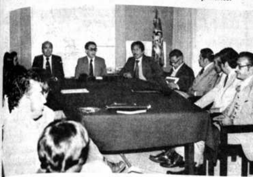
HUELGA ILEGAL. El gobierno, a través del Ministerio de Salud, declaró ilegal la huelga general convocada por los médicos, en demanda de una "racionalización salarial". La actitud del gobierno fue apoyada por la Central Obrera Boliviana.

COB y autoridades emplazan a huelguistas a volver al trabajo, a más tardar, hasta el mediodía de hoy. - Médicos, dispuestos a dialogar, piden cumplimiento de convenio sobre racionalización salarial. - Funcionan servicios de emergencia en todos los centros hospitalarios.