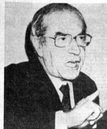
Denuncia: Santiago de Chile, 7 (AP). - El presidente del Partido Demócrata Cristiano de Chile, Gabriel Valdés, acusó ayer al gobierno de hacer crímenes de lesa humanidad en las que se lo califica como traidor. "Esta campaña crea un clima de odio y de violencia", dijo a la prensa.