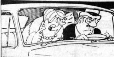
DANIEL EL TRAVIESO