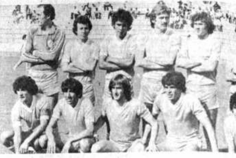
BOLIVAR. Comienza esta noche una serie, de a lo mejor cinco partidos, entre "celeste" y su tradicional rival, The Strongest. Bolívar está más descansado que The Strongest.

jugadores bolivianos sientan respaldos compartidos. Esta manera de hacer patrocina la forma de premiar a los jugadores bolivianos que luciran con el orgullo de la camiseta acotaron.