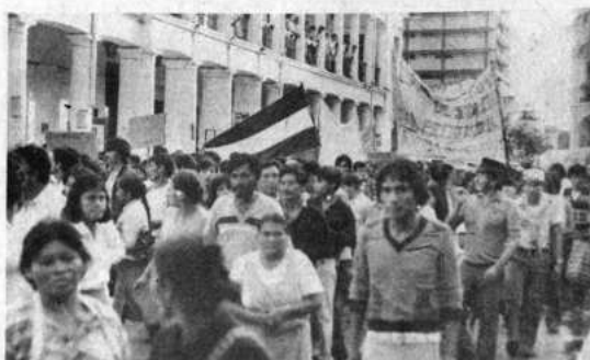
DAMNIFICADOS.- Los albergados en el plan 3.000 de Santa Cruz realizaron una manifestación pidiendo mayor atención y renuncia de las autoridades. Recibieron lótes, atención médica, alimentos, ropa y ninguno se presentó al llamado para cosechar algodón; piden trabajo en la ciudad.