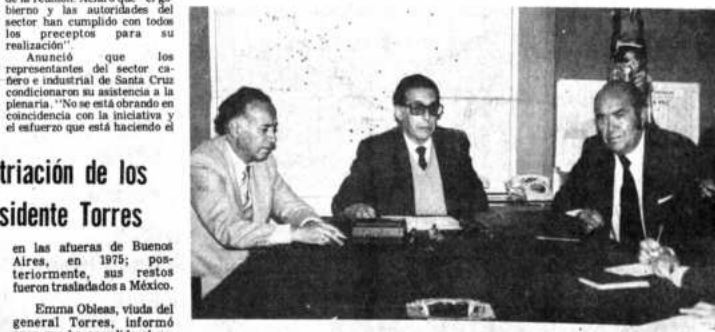
Comité de repatriación de los restos del presidente Torres