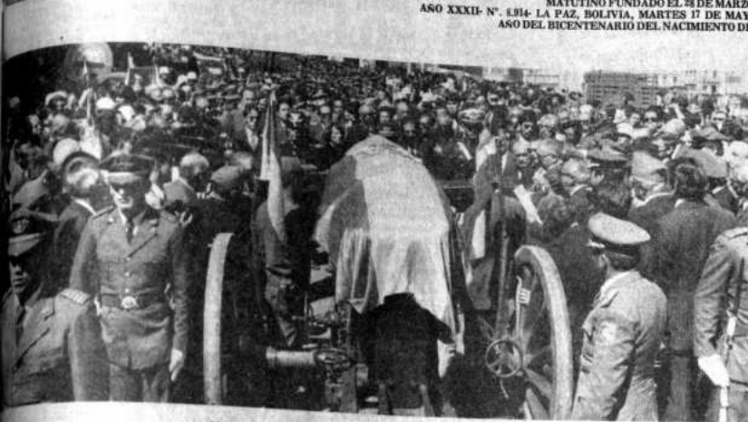
Homenaje póstumo al Gral. Billauro Billauro