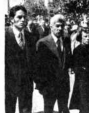
El ministro de Finanzas, Flavió Machicado, con funcionarios del Banco Minero de Bolivia.

El Aereo Boliviano pudo ayer en vigencia nuevas tarifas de servicios de transporte de pasajes y carga en rutas de líneas aéreas. Las nuevas tarifas han sido incrementadas hasta el 65 por ciento de las que regían en octubre del pasado año. Según el decreto supremo 10206, de 27 de octubre de 1982, autorizado al LAD a elevar sus tarifas en un 65 por ciento, empresa, habiendo aplicado una elevación de sólo el 15 por ciento en las tarifas en la ruta troncal y del 34 por ciento en las de las rutas nacionales.