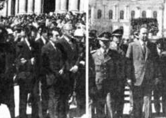
El ministro de Finanzas, Flavió Machicado, con funcionarios del Banco Minero de Bolivia.