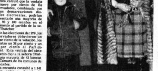
EXPULSADO. Londres 17 (AP). - El traductor soviético Vladimir Chernov, en el aeropuerto de Londres, posea con su esposa Valentina y su hijo Anton con destino a Moscú. Fueron expulsados de Inglaterra por presentar actividades de espionaje.

ROMA, 17 (EFE). - Los sindicatos italianos convocaron para mañana una jornada de huelgas y manifestaciones en toda Italia. El llamamiento es para un paro general de los trabajadores de la industria y de los servicios, pero las huelgas se prolongarán durante gran parte de la semana, dijeron los sindicatos. Turin, y se transforman en huelgas generales en diversas regiones. Los sindicatos italianos realizaron una gran jornada de fuerza frente a la organización patronal "Confindustria" y contra las huelgas de los trabajadores de la industria y de los servicios, pero las huelgas se prolongarán durante gran parte de la semana, dijeron los sindicatos. Turin, y se transforman en huelgas generales en diversas regiones.