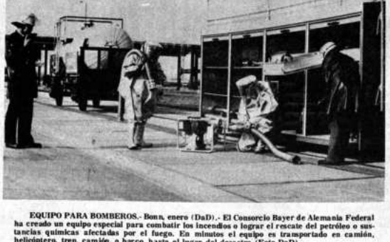
EQUIPO PARA BOMBEROS. Bonn, enero (DaD). - El Consorcio Bayer de Alemania Federal ha creado un equipo especial para combatir los incendios o lograr el rescate del petróleo o sustancias químicas afectadas por el fuego. En minutos el equipo es transportado en camión, helicóptero, tren, camión, o barco, hasta el lugar del desastre (Foto DaD).