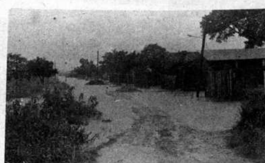
ABANDONADO.- El barrio 27 de Mayo en Trinidad, tuvo que ser abandonado por sus habitantes ante la invasión de las aguas. Los vecinos buscaron refugio en las escuelas en espera de que baje la intensidad de las inundaciones. No obstante las previsiones, la capital del Beni volvió a ser víctima de la crecida de los ríos y se temen daños mayores en todo el departamento.