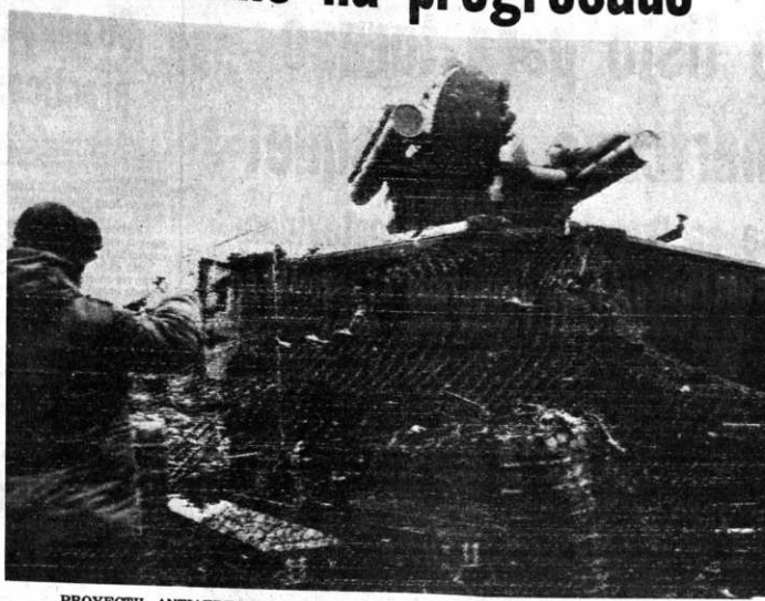
PROYECTIL ANTIAEREO.- Buenos Aires, 27 (AP).- Un soldado argentino camufla un proyectil anti-aéreo en las Malvinas, en esta fotografía oficial difundida hoy en Buenos Aires.

Continúa censura soviética a la acción británica en las Malvinas MOSCÚ, 27 (I.R.).- El alarde y la histeria militar en Gran Bretaña han dado paso al dolor y la gente se está dando cuenta del verdadero costo de la crisis de las Malvinas por primera vez, dijo hoy la agencia noticiosa soviética TASS. TASS dijo que el cambio de humor había sobrevenido a raíz del hundimiento del destructor Coventry y los graves daños al carguero Atlantic Conveyor, causados por los ataques aéreos argentinos esta semana. "Los ingleses están comenzando a darse cuenta por primera vez del enorme precio que debe ser pagado por las ambiciones imperiales de Margaret Thatcher", agregó. La agencia también atacó a los países de Europa Occidental que apoyaron a Gran Bretaña con la declaración de un embargo indefinido a las importaciones argentinas. "Al alentar la intervención británica están, de hecho, convirtiéndose en cómplices de Gran Bretaña al crear un peligroso foco de tensión en el Atlántico Sur", dijo TASS. Los Estados de Europa Occidental han torpedeado eficazmente los intentos del Secretario General Javier Pérez para lograr un acuerdo pacífico en las Malvinas, porque nunca le dieron ningún apoyo real, dijo TASS.