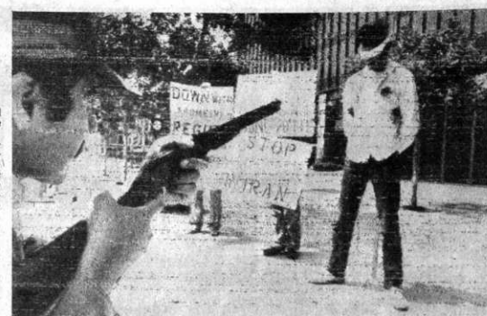
SIMULACRO.- SAN DIEGO, CALIFORNIA (AP). - Un estudiante iraní en San Diego, simuló una explosión para protestar por la violencia del régimen del Ayatollah Khomeini.

Los cuatro ministros de Asuntos Exteriores y el representante de la OLP, reunidos en Argel, subrayaron que ni Irán ni su revolución islámica son enemigos del mundo árabe.