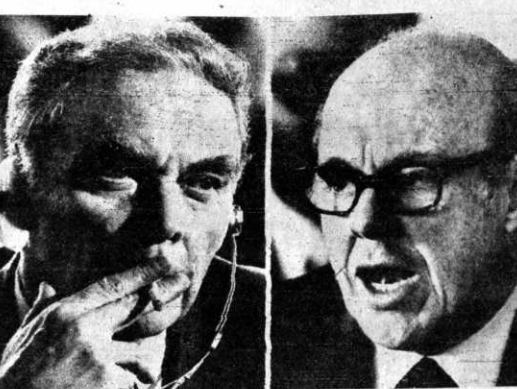
CANCILLERES. WASHINGTON, 27 (AP). - El canciller argentino Costa Méndez, derecha, y el Secretario de Estado, Alexander Haig, durante la reunión celebrada hoy en la OEA para tratar la situación actual en el Atlántico Sur.

Las últimas declaraciones del presidente Reagan habrían llevado una cierta confusión, al hablar de controlar el número de cabezas nucleares. Teniendo en cuenta que las armas de múltiples cabezas no pueden ser controladas, dio la impresión de que lo que se limitaban eran los lanzadores.