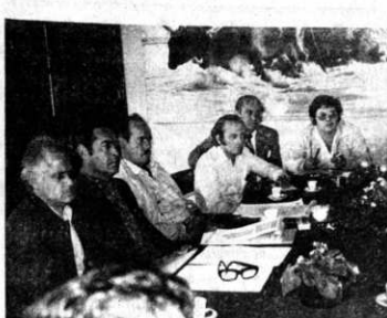
PLAN DE ACCION.- Autoridades y representantes de diversas entidades cruceñas analizan un plan de acción, que la Prefectura de ese departamento se propone cumplir en lo que resta de la presente gestión.