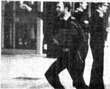
RETORNO.- Brize Norton, Gran Bretaña, 27 (AP). - Un oficial del Sheffield, hundido en aguas de las Malvinas, regresa a su país.