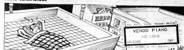
DANIEL EL TRAVIESO