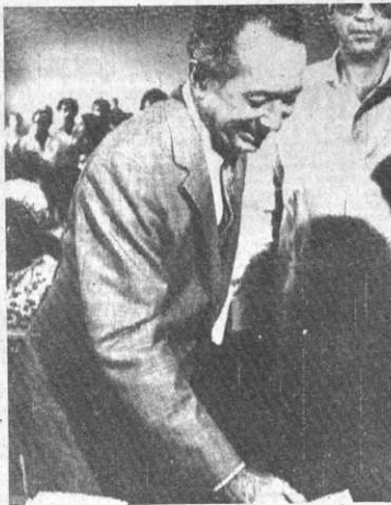
CANDIDATO.- Santiago, República Dominicana 17 (AP).- Salvador Jorge Blanco, candidato de centro-izquierda por el Partido Revolucionario Dominicano, deposita su voto en las elecciones del domingo. En el lento escrutinio lleva ventaja sobre Joaquín Balaguer, uno de los principales favoritos para la Presidencia.

Finalmente el "SELA" se encuentra en una situación excepcional como posible opción política, "ante la resquebrajadura que ha sufrido el sistema interamericano (OEA)", pronostica la publicación.