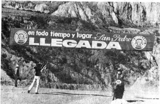
MOTOCICLISMO.- El vencedor de la categoría 175 cc en el "Circuito Lomas del Sur", aparece cruzando la línea de llegada.