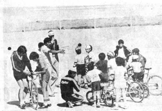
CICLISMO INFANTIL.- Pequeños ciclistas, que participaron en las pruebas efectuadas el domingo en el velódromo de Alto Irpavi.

Polacos entrenan para el Mundial. VARSOVIA, 17 MAY (EFE). La selección nacional de Polonia salió hoy para Stuttgart (Alemania Federal) con el fin de preparar sus últimos partidos antes del comienzo del Mundial-82.