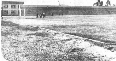
COMPLEJO DEPORTIVO FABRIL COCHABAMBA UBICADO EN LA ZONA DE SARCO

AFOPAL - ADMINISTRACION Y FISCALIZACION NACIONAL DE FONDOS Y PATRIMONIOS LABORALES.