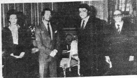
DELEGACION.- Estocolmo 29 (AP).- El rey Gustavo de Suecia recibió a una delegación de la Junta de Gobierno de Nicaragua. En la foto: Nora Astorga, vicesecretaria; el Rey Gustavo; Sergio Ramírez, miembro de la Junta y Oscar Cortés Condero, embajador de Nicaragua.

Interesados, presentar sus currículums y certificados, antes del lunes 3 y el miércoles 5 de mayo, en Parque Zenón Iturralde N° 121 (Av. Arce).