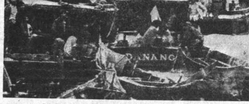
REFUGIADOS. Hong Kong, 29 (AP). Algunos de los 384 refugiados vietnamitas que llegaron esta semana a Hong Kong aparecen a bordo de sus embarcaciones. Los refugiados son el mayor grupo que llega desde Vietnam este año (Radiofoto AP).

Se espera que Kaunda exhortará a Botha a que acepte el ascenso al gobierno en Namibia de la Swapo, que tiene apoyo ovinio y que Sudafrica considera virtualmente como un grupo comunista. El Presidente de Zambia también exhortará al gobierno sudafricano a que de consentimiento a la independencia de Namibia, que es un territorio africano, que no pueden ser ciudadanos de su país excepto los negros establecidos por las autoridades blancas.