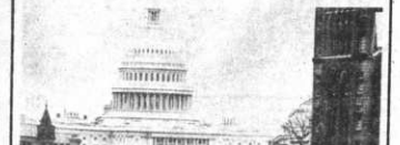
FIN DE LA GUERRA DE VIETNAM es celebrada en la avenida Pensilvania de Washington.

1933 - Es asesinado a tiros el presidente del Perú. 1945 - Adolf Hitler, jefe de Estado alemán, se suicida de un tiro en la cabeza en Berlín. 1953 - El Partido Popular Nicaragüense gana las elecciones en la Guyana Británica. 1975 - Tropas norvietnamitas y guerrilleros vietnamitas ocupan a Saigón, capital de Vietnam del Sur, poniendo así a la Guerra de Vietnam.